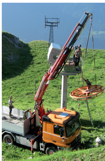
STA réalise beaucoup des travaux de montage en Suisse romande.

le contrôle visuel des câbles, qui peut être loué auprès de STA, ou bien les collaborateurs de STA assurent eux-mêmes le contrôle des câbles. L'entretien des véhicules militaires constitue un autre pilier de l'entreprise.