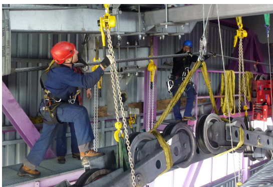
Démontage d'un balancier lourd dans la gare amont du Funitel à 2'730 m pour l'inspection en atelier.