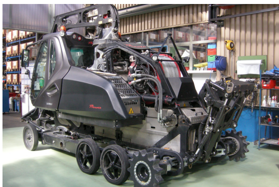
Des engins de chantier et véhicules agricoles sont révisés à côté de véhicules de pistes.

STA emploie aujourd'hui environ 40 collaborateurs toute l'année et représente ainsi un employeur important de la région de Sembrancher. L'entreprise réalise un chiffre d'affaires de 7,2 millions de francs. Du point de vue déserte, STA est bien placé à Sembrancher. A dix minutes de la sortie autoroutière de Martigny, de même qu'à proximité de l'Italie et de la France sa situation offre à l'environnement des potentiels de croissance pour l'entreprise de même qu'à l'étranger proche. Un agrandissement des locaux est actuellement en cours sur le terrain de l'entreprise. STA bénéficiera au printemps prochain d'un plus grand nombre de locaux administratifs, qui pourront également être loués à des entreprises tierces.